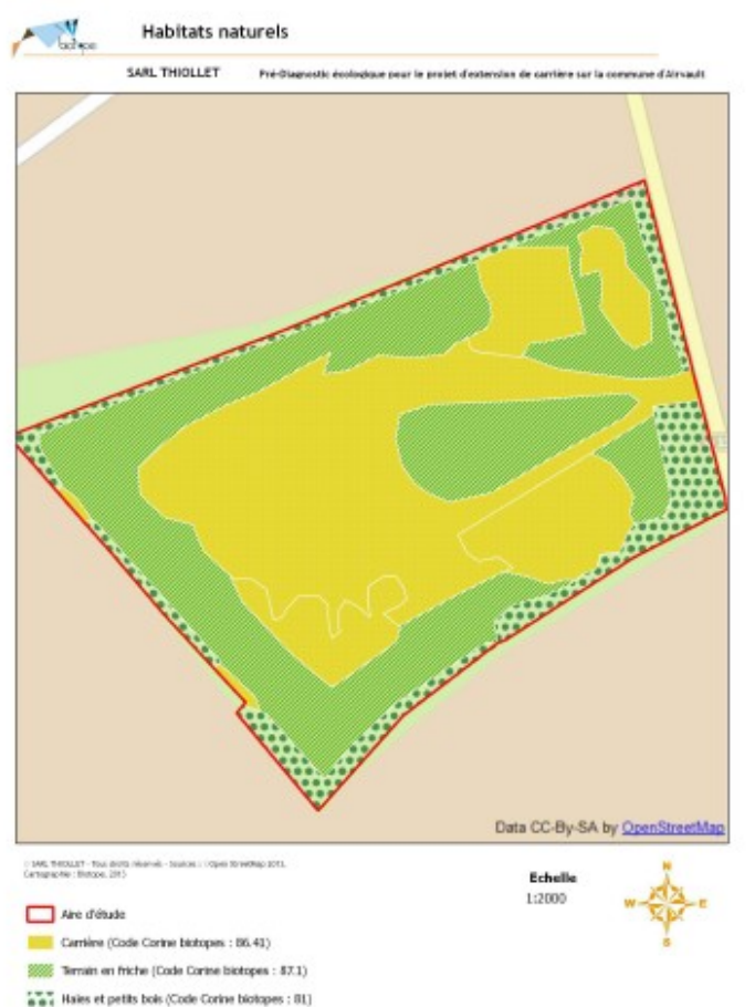
Habitats identifiés

Le rapport conclut que la configuration du site, sa localisation et les habitats présents semblent peu favorables au développement d'espèces remarquables.