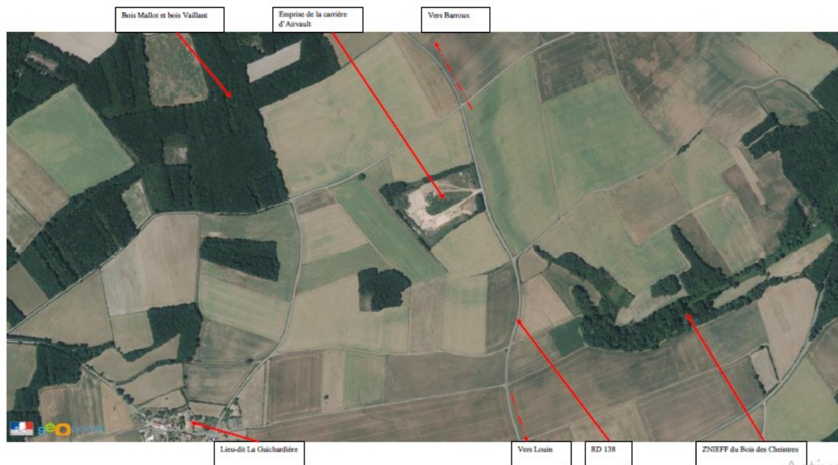
Environnement site (source : étude d'impact p.79)

Le site étudié se trouve en bordure de la RD 138. Il est peu visible depuis la route, et des arbres et des plantations ont été conservés à l'entrée et aux alentours du site.