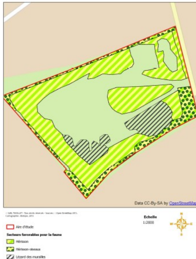
enjeux faunistiques (source : pré-diagnostic écologique p.14)

À ce stade, des mesures sont prévues pour limiter les impacts sur le milieu naturel, dont un plan d'exploitation permettant le maintien au maximum de surfaces enherbées ou en friche ainsi que d'une bande de dix mètres en bord de site.